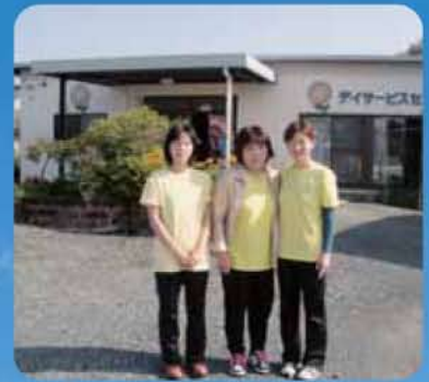
デイサービスセンターひまわり