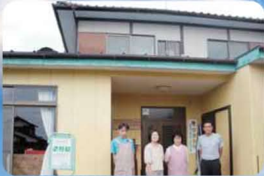
居宅介護支援事業所ひまわり 訪問介護サービスひまわり ぬくもいホーム ふれ愛みやき