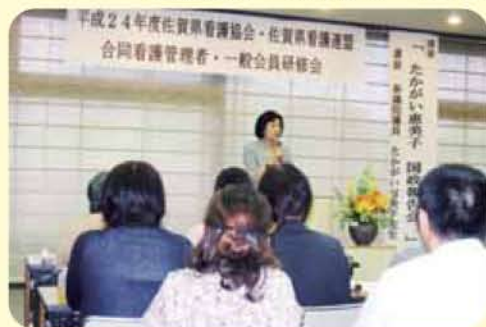
文化会館 6月2日 124名参加