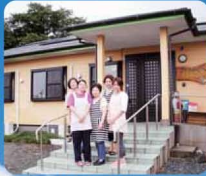
グループホーム ひまわりの郷