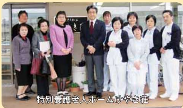
特別養護老人ホームけやき荘