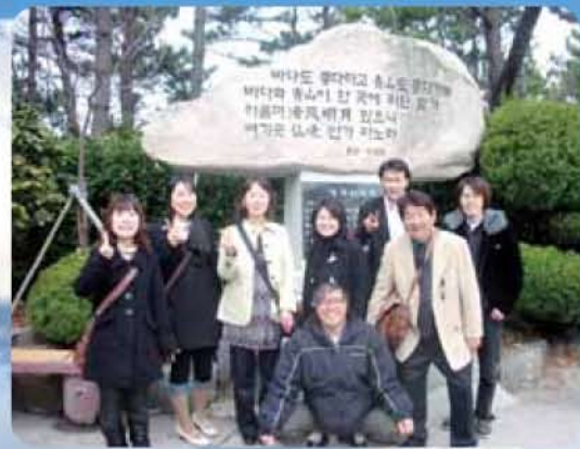
韓国の介護実習生(年2回実習受入れ)